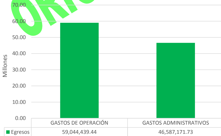
GRÁFICA 2 EGRESOS